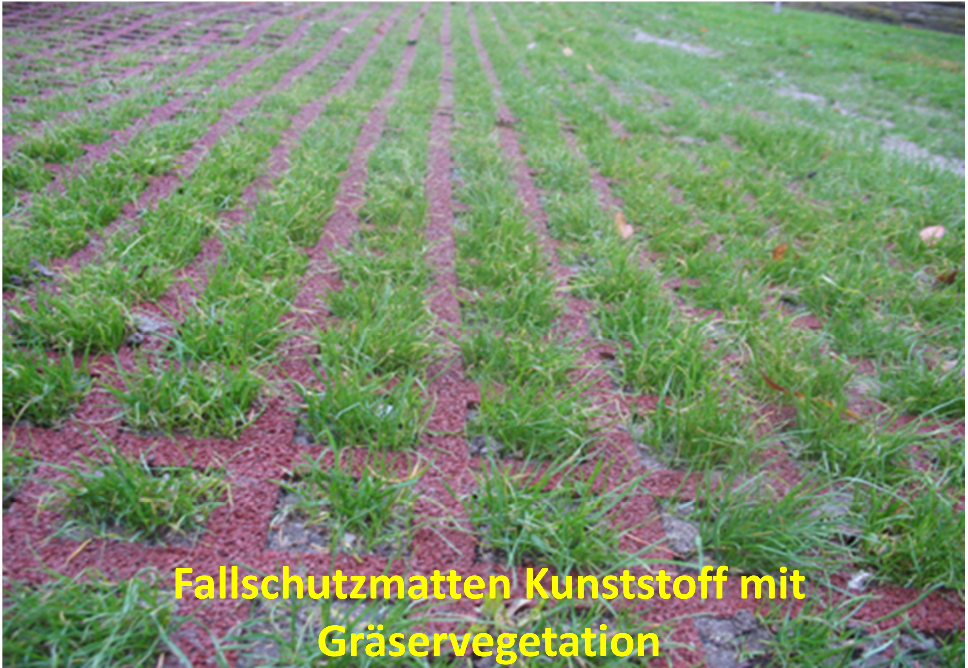
Fallschutzmatten Kunststoff mit Gräservegetation